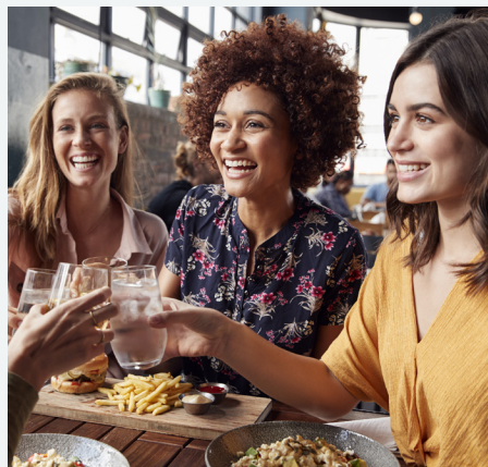
REÚNETE PARA ALMOZAR CON UN AMIGOS