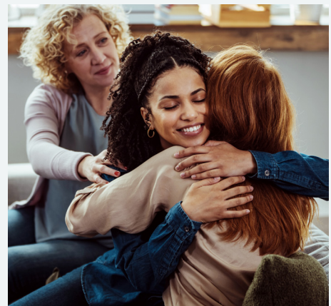
ÚNETE A UN GRUPO DE APOYO

Actividades como estas ayudan a disminuir el estrés, levantar el ánimo y a que seas la mejor cuidadora posible.