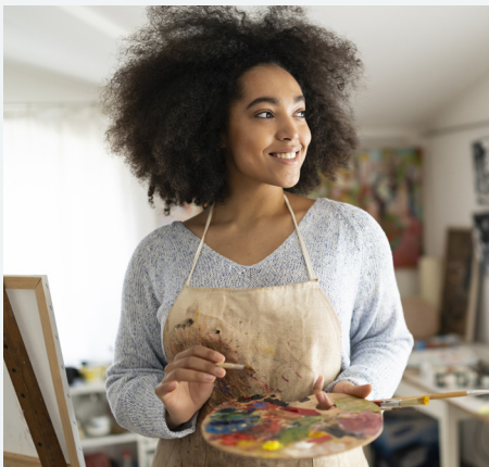
HAZ TIEMPO PARA PASATIEMPOS